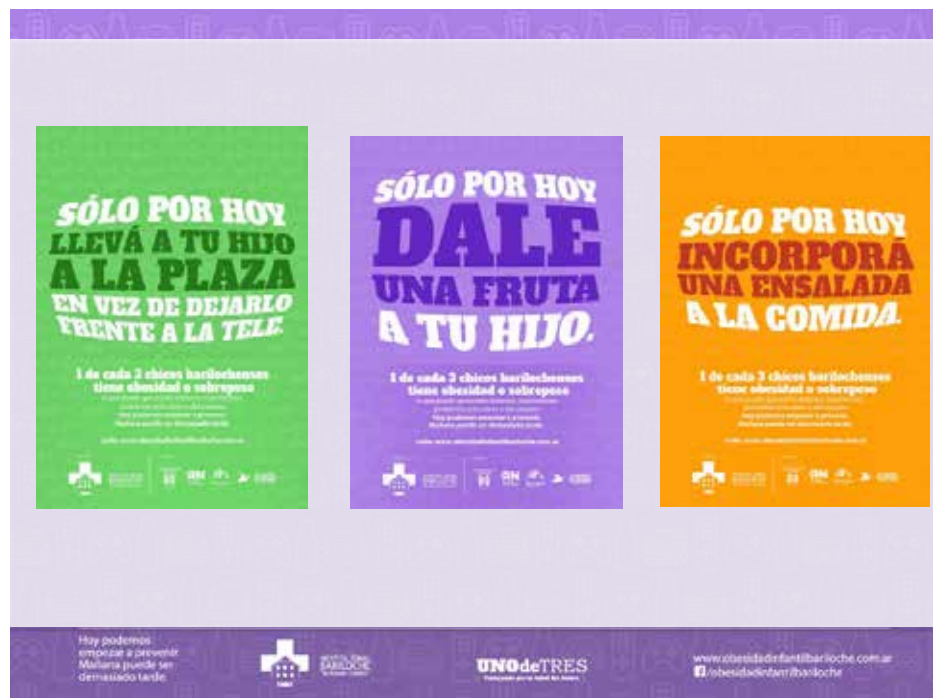
Figura 1 Mensajes Campaña “Solo por hoy”