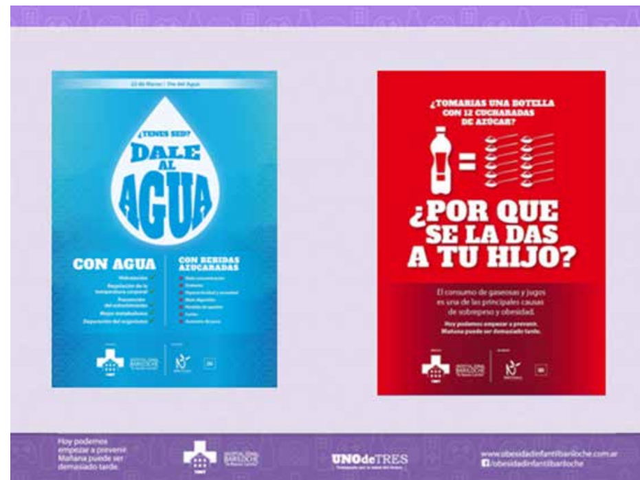
Figura 2 Mensajes Campaña “Dale al agua”